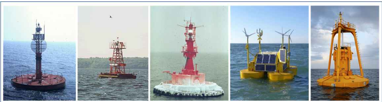
국내외 대형 부표류