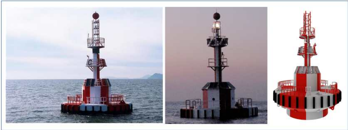
국내 표준형 등부표

* 국가법령정보센터 웹사이트( www.law.go.kr ) → 「표준형 부표 제작 및 품질관리 기준에 관한 규정」의 별표 2. 표준형 부표의 도면 참조