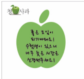
요청에 응답하는 사과