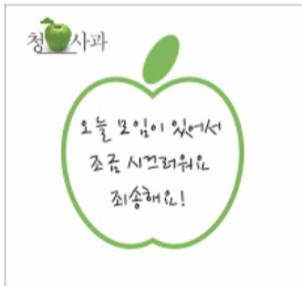
도움을 요청하는 사과

이웃에 도움을 요청하는 청사과 이웃에 피해가 예상될 때 먼저 도움을 청하며 사용하는 사과 쓰고 답하기