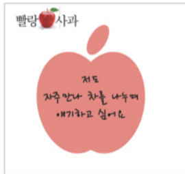
화해에 응답하는 사과