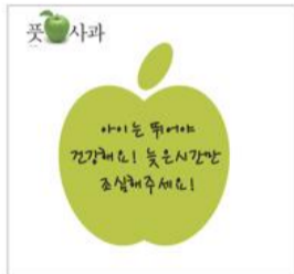
사과에 응답하는 사과