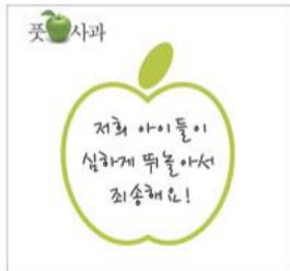
사과를 요청하는 사과

이웃과 사과할 때 사용 이웃간 작은 갈등을 초기에 푹푹하게 웃으며 사과하는 사과 쓰고 답하기