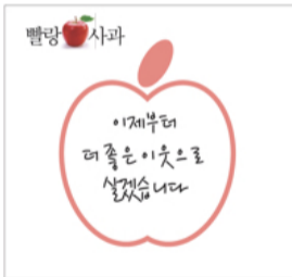
화해를 표시하는 사과

이웃과 화해를 표시하는 빨랑사과 빠른 이웃관계 회복을 위해 화해를 표시 할 때 사용하는 사과 쓰고 답하기