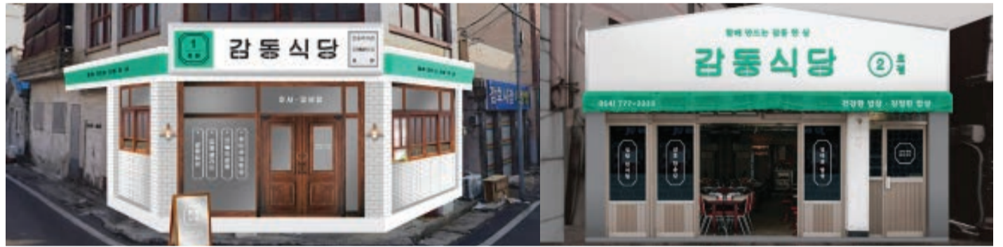
감동식당 1호점(감호시장점) 1호점 Main Target 전국단위의 김천 스포츠 행사 및 체육대회 등에 참가하기 위해 숙박시설을 이용하는 체육 선수들 (몸 관리와 컨디션 조절이 필요한 체육 선수들)