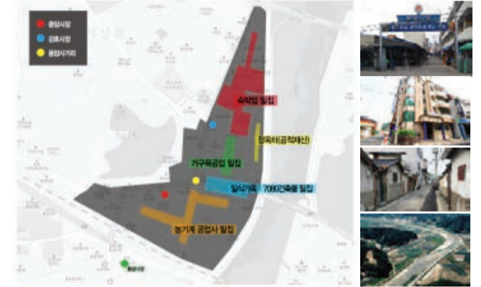
경상북도 김천시 아랫장터 5길 31-3(감호동) 일원