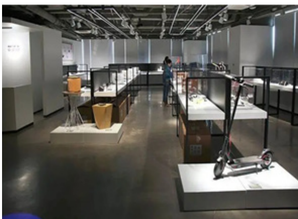
국제 수상작 세션