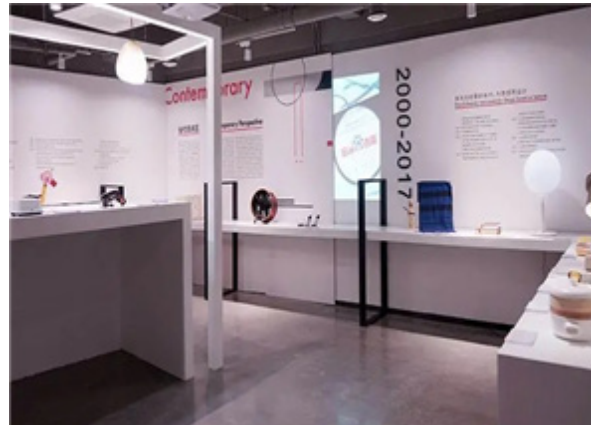
현대적 관점 세션