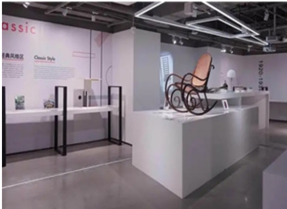
전통적 스타일 세션

● 시간의 흐름에 따라 세 개의 주요 전시구역으로 나누어 전통적 스타일 세션, 현대적 관점 세션, 미래 해석 세션으로 산업디자인이 가진 시공간의 문을 연다. 박물관은 장기적으로 국내외 시민들에게 무료 개방한다.