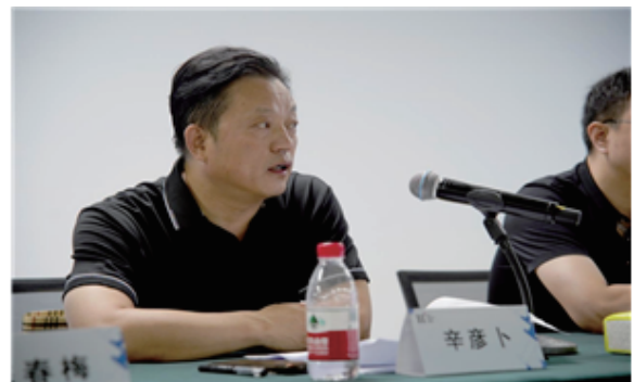
<신지시 공업정보화국 국장 신옌푸(辛彦卜)>