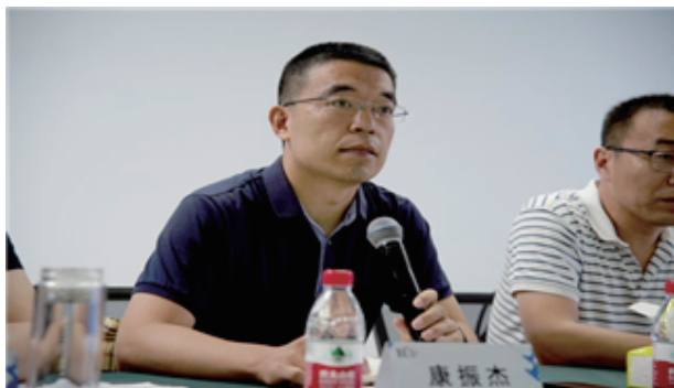
<허베이성 공업정보화청 부처장 강전제(康振杰)>

이번 회의는 허베이성 공업정보화청 부처장 강전제(康振杰)가 주재하고 신지시 공업정보화국 국장 신옌푸(辛彦卜)가 발표를 했다. 신 국장은 성급 공업정보화청의 전폭적인 지원과 지도하에 우리 시(市) 산업발전의 질이 지속적으로 향상되고 있다고 말했다. 우리 시는 산업디자인혁신센터의 건설을 적극 지원하고 산업디자인 특별기금을 설립하여 대규모 디자인대회, 디자인 세미나, 기업방문 활동, 디자인 스튜디오, 디자인 전문인력 도입으로 강한 산업디자인 발전 분위기를 형성하였다.