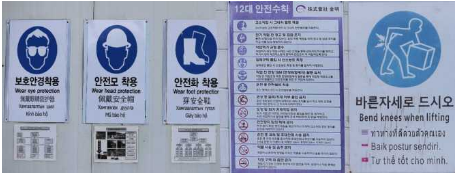
예시) 산업체 안전사고 예방을 위한 매뉴얼(작업 진행 중)