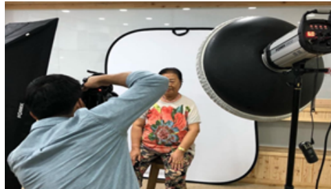
입주민대상 사진 촬영