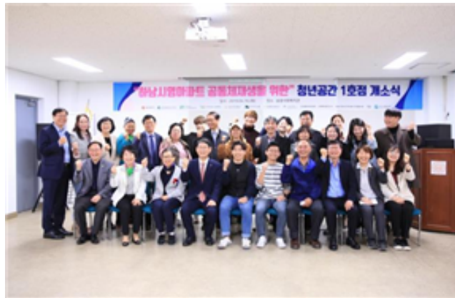
청년주거 1호 개소식