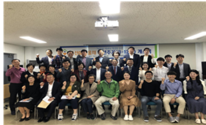
청년주거 3-12호 개소식