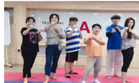
태권도 클래스(매주 1회)