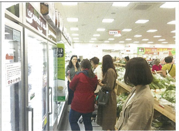
로컬푸드 매장 방문