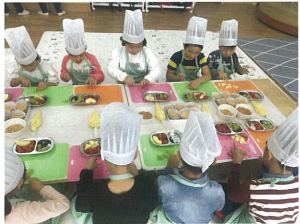
돌봄교사 제공 레시피