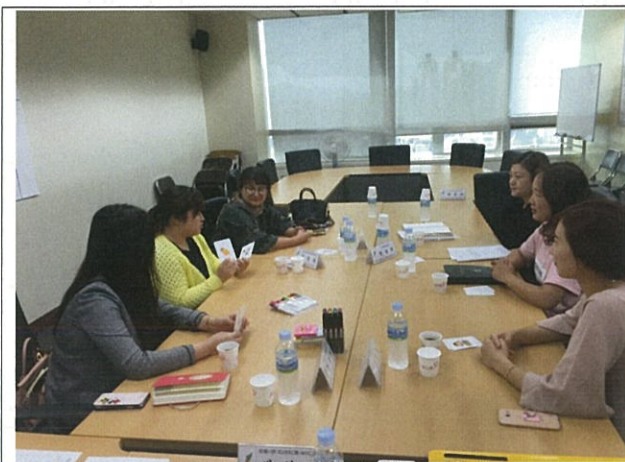
협력기관 및 전문가 회의