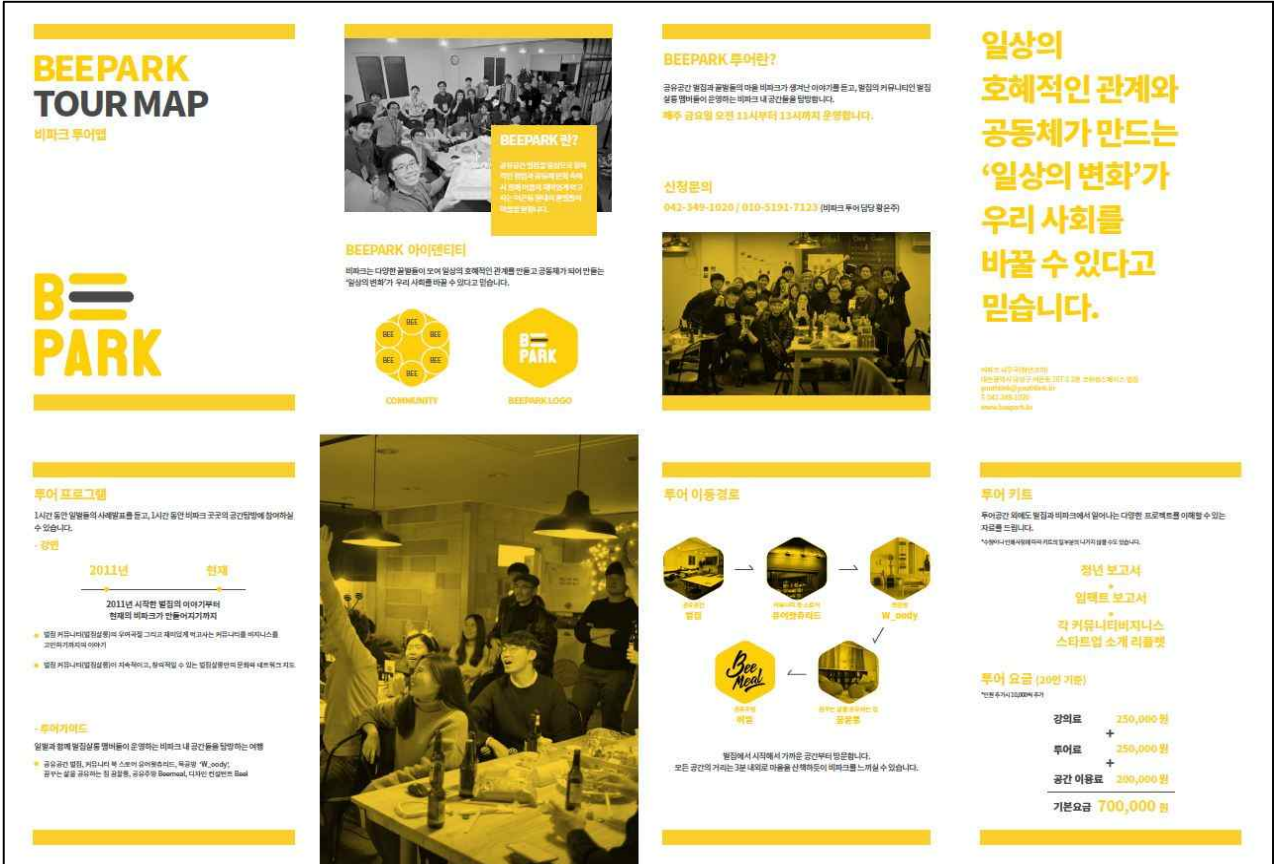
2017년 공유마을(비파크) 여행지도