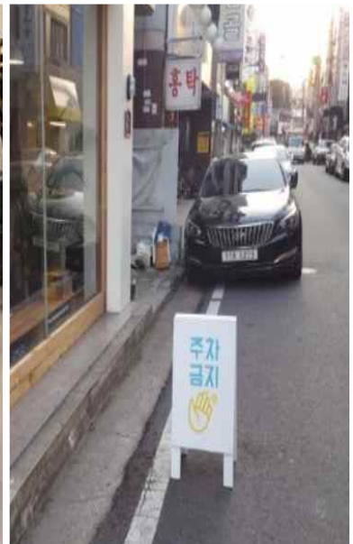
<안녕가게 비스토어 주차표지판>