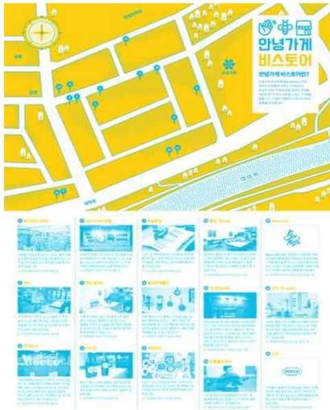
안녕가게 비스토어 리플릿

* 2016년 15개 → 2017년 조사결과 37개 → 국민디자인단 사업 이후 49개