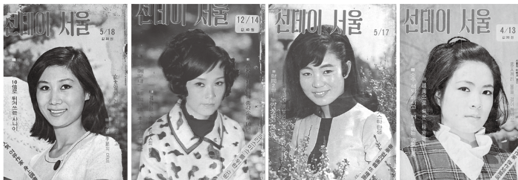
[그림 2] (왼쪽부터) ① 1969.5.18. 제34호-소장용, CAL(중화항공공사) 사무직, 서라벌 예대 공예과 졸업, '반도' 호텔 오피스에서 일함, 47년생(22살), ② 1969.12.14. 제64호-소장용, 경북도청 도시사 비서실, 경북여고 졸업 후 바로 도청에 취직, 1948년생(23살), ③ 1970.5.17. 제85호-소장용, 23살, 대원보일러 경리과, ④ 1969.4.13. 통권29호-e뮤지엄 공공누리, 국회사무처

때 길거리에서 가장 손쉽게 취할 수 있었던 대중오락 수단이었다는 점이 있다. 도시화 및 산업화로 인해 유발된 생활환경의 급속한 변화, 특히 고속도로의 개통과 더불어 각종 교통수단을 통한 이동인구의 급증은 이동 중에 가볍게 읽을 수 있는 읽을거리를 대상으로 한 대중적 수요를 촉발시켰다. 9) 1970년대 우리나라는 전국적 규모로 고속도로가 개통되는 시기였는데, 이것이 촉발 요인이 되어 대중적 여가(mass leisure) 및 대중적 풍요(mass affluence)가 한국 사회에도 어느 정도 나타나기 시작한 시기였다고 할 수 있다. 대중의 일상적 생활공간 곳곳에 매스 미디어를 통한 대중문화의 내용적 발산이 이루어지는 기반이 조성되었다.