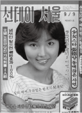
[그림 5] (왼쪽 위부터 오른쪽으로) ① 1975.3.23.제334호-소장용, 텔런트, 20살, 방송공사 1기, ② 1980.9.14.제615호-소장용, 22살, KBS TV 텔런트, 드라마 연기, ③ 1973.10.14.제261호 -e뮤지엄 공공누리, 모델, ④ 1975.1.5-e뮤지엄 공공누리, 여배우, ⑤ 1976.4.4.제387호-e뮤지엄 공공누리, 표지모델, ⑥ 1976.10.31.제417호-e뮤지엄 공공누리, 표지 CM모델, ⑦ 1977.6.12.제448호-국립민속박물관, 텔런트, ⑧ 1973.12.16.통권 제270호-e뮤지엄 공공누리, 노래하는 표지, 가수, ⑨ 1974.1.27.제275호-e뮤지엄 공공누리, 노래하는 표지, 가수, ⑩ 1979.9.9.제12권 제36호-통권563호 e뮤지엄 공공누리, 소녀배우 가수