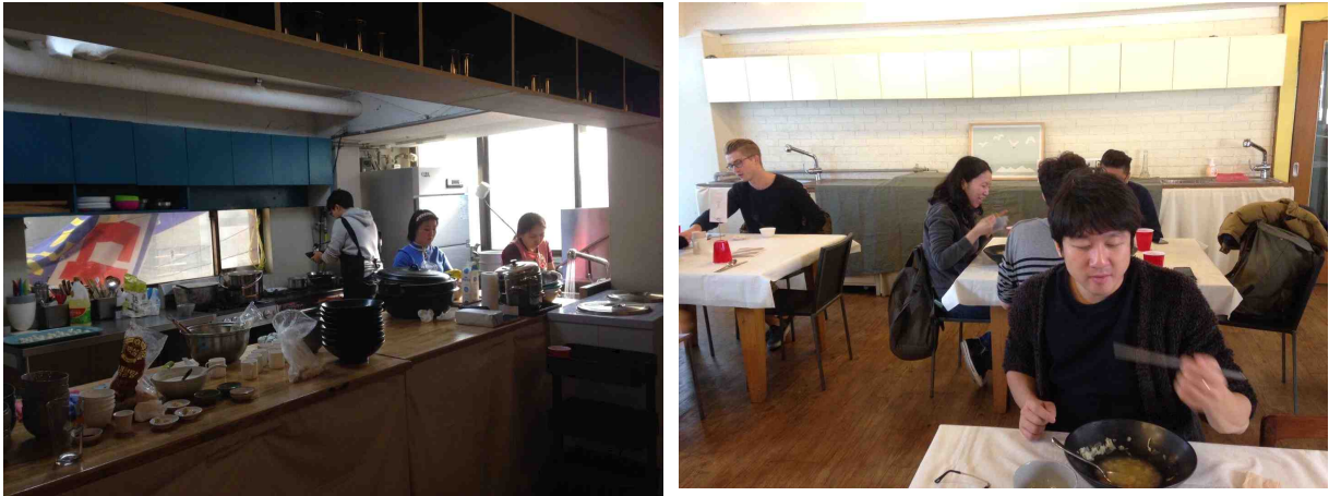
(예시 : 몽골 전통 음식 소셜다이닝 / 2015년 11월 서울)

⇒ 예비 창업자가 자신만의 요리를 일반인에게 선보일 수 있는 기회 마련 (구체적인 피드백과 창업 이전의 충분한 노하우 습득 가능)