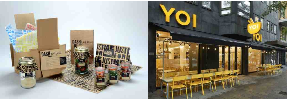
(예시 : 브랜드 로고 및 패키지, 인테리어 컨셉 브랜딩)