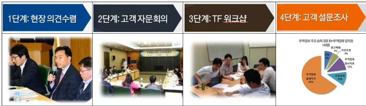
<단계별 의견 수렴>