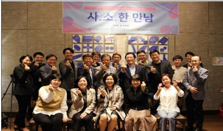
2019.03 신세계 I&C