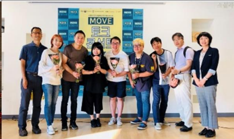
2019.03 MOVE 선정