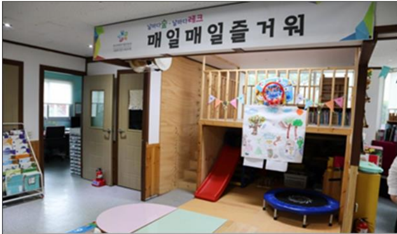
2017.03 법인 설립