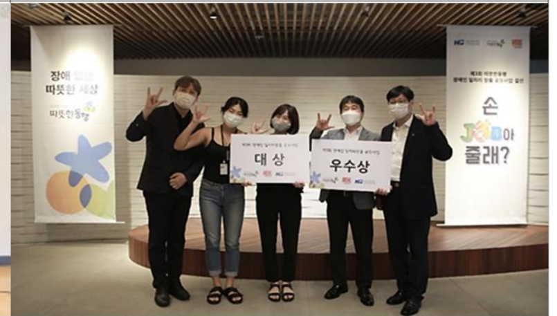
2020.08 장애인 일자리창출 공모전 우수상