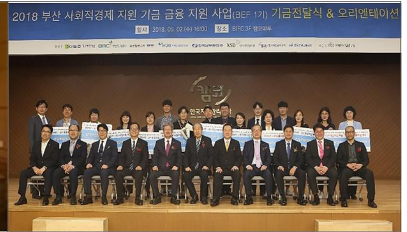
2018.05 BEF 1기 부산 사회적경제 지원기금 금융지원사업 선정