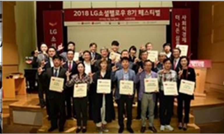
2018.04 LG 소셜캠퍼스 친환경 분야 사회적경제 지원사업 선정