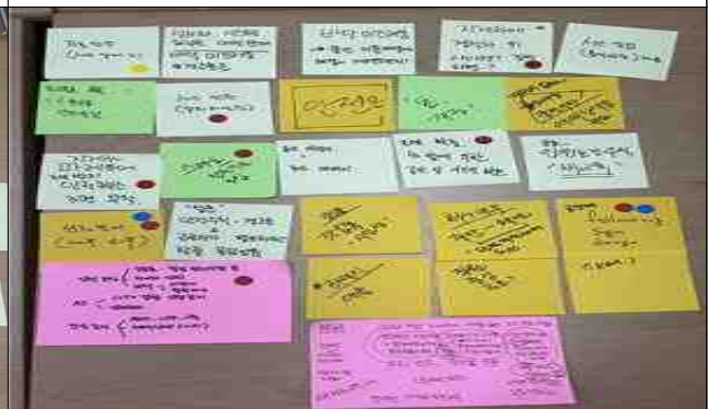
근로자 안전을 위한 아이디어이션