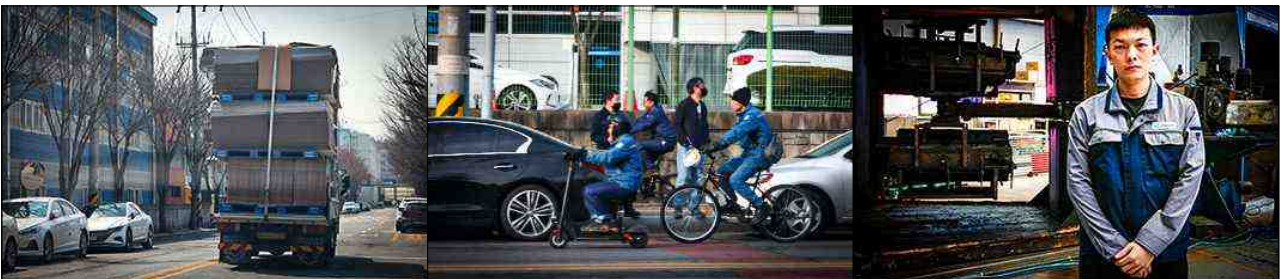
선유산업단지에 대한 대표 이미지