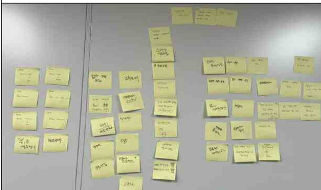
주요 과제 및 이슈 도출