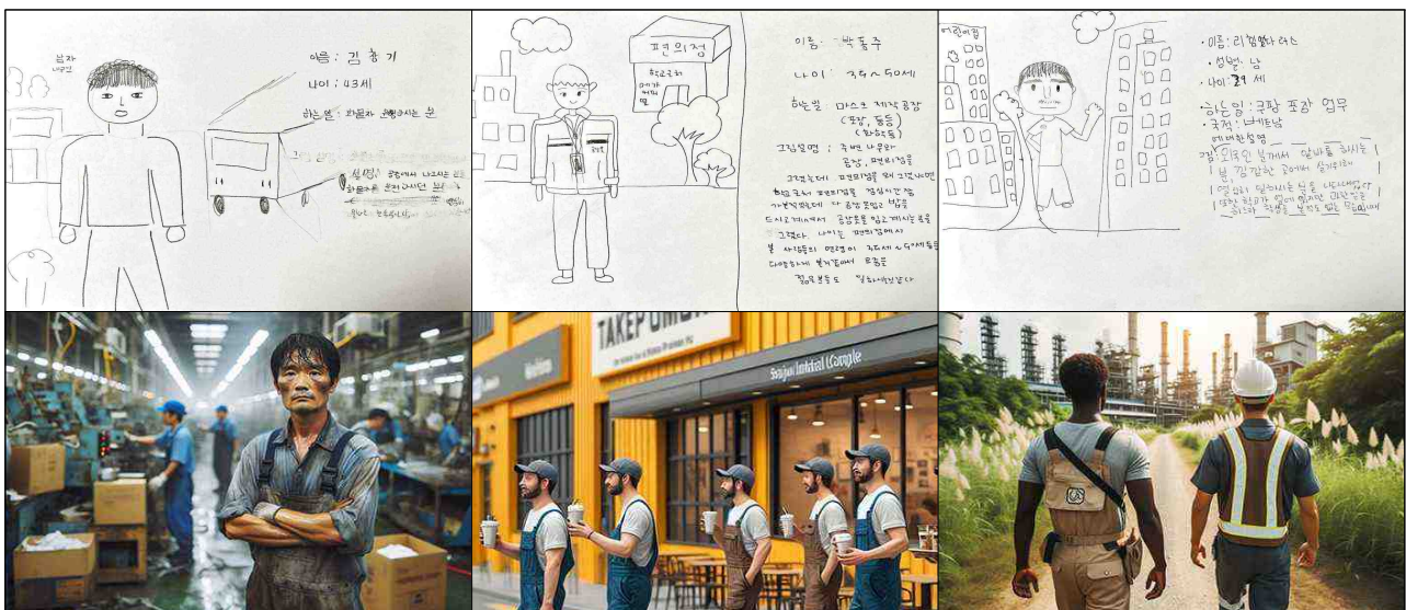
선유산업단지, 근로자에 대한 이미지 그림과 AI 시각화