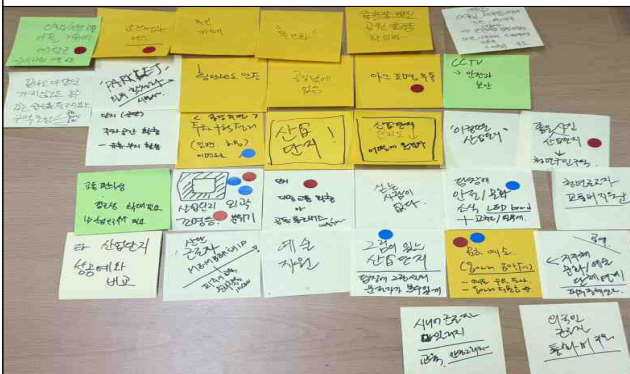
환경/문화개선을 위한 아이디어이션