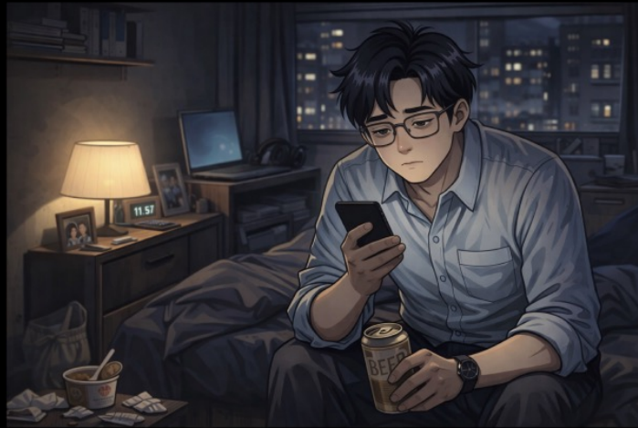
남들과는 다른 시간대에 집에 돌아와 늦은 밤 갈 곳 없이 핸드폰을 연다