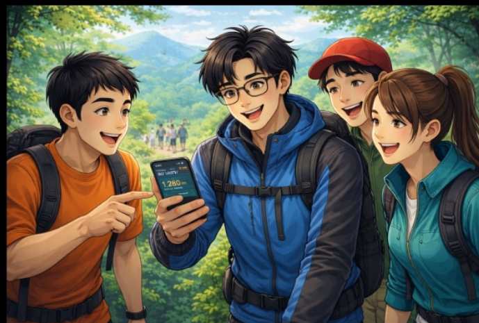
이후에 직접 사람들을 만나면서 산단에서 즐거운 삶을 살게 된다