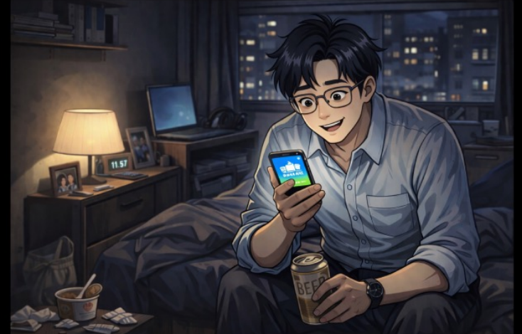
퇴근하면서 버스광고에서 봤던 '산단파크' 라는 어플에 들어가본다