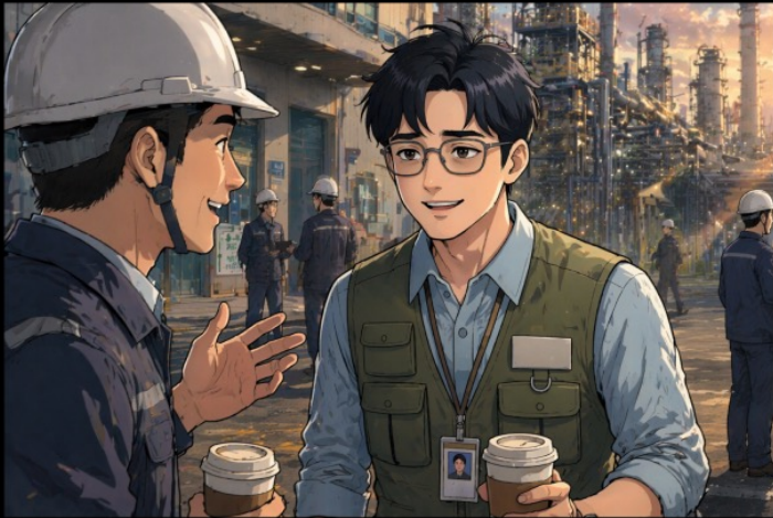
타지에서 휴일이 뒤죽박죽인 근무일정을 소화한다.