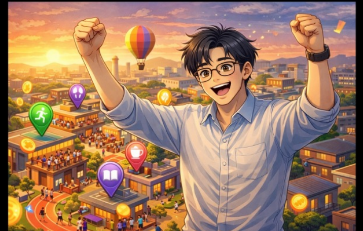
산단에서 살고싶은 즐거운 커뮤니티를 형성하고자 한다