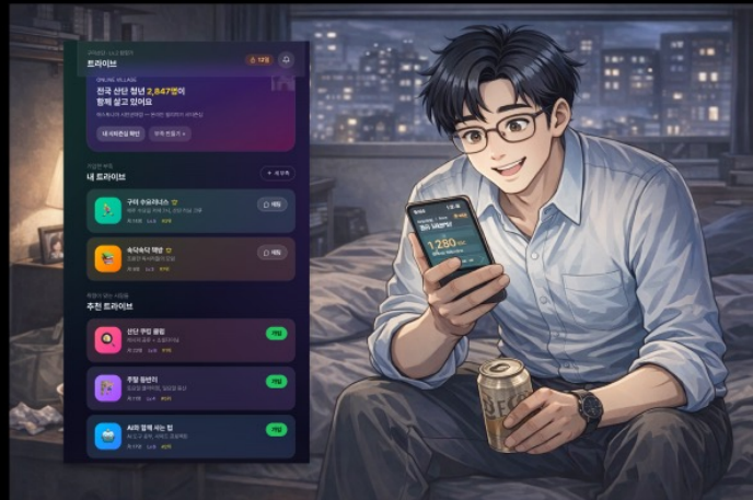
처음엔 그냥 다른 사람들 좋아요, 댓글만 달면서 온라인에서 즐긴다