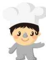
CH - D13