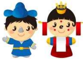
CH - D502