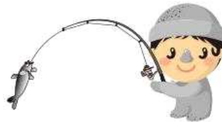
CH - D09