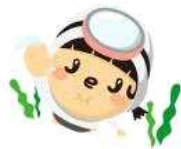
CH - S05