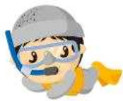
CH - D10