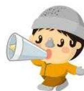
CH - D14