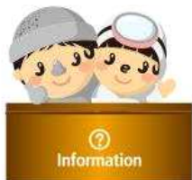
CH - D503