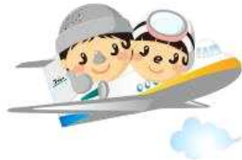
CH - D501

jeju.go.kr/jeju/symbol/character/main.htm