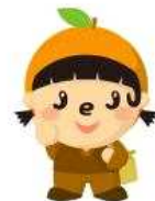
CH - S06