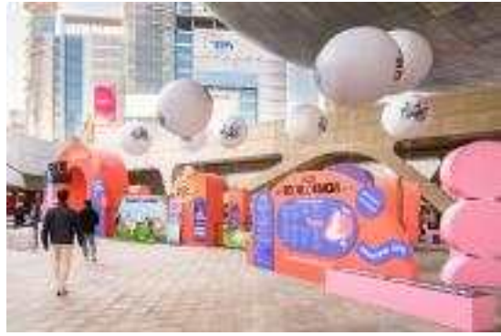
[서울디자인 2022] 행사장 전경