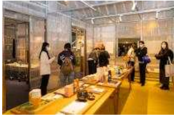
[서울디자인 2022] 기업브랜드관 -코오롱스포츠 부스