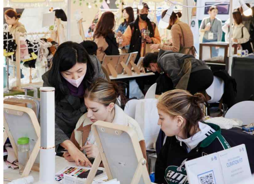
[서울디자인 2022] 디자인마켓