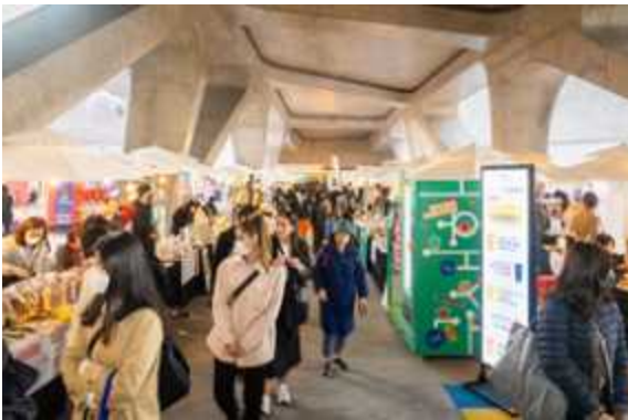
[서울디자인 2022] 디자인마켓