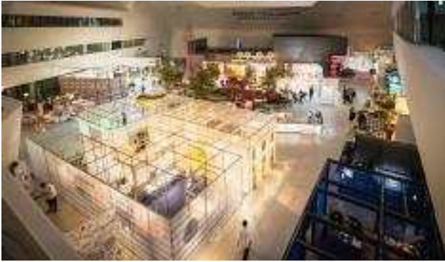
[서울디자인 2022] 행사장 전경