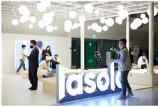
[서울디자인 2022] 기업브랜드관 -한솔홈데코 라슬라 부스