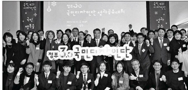
정중섭(둘째줄 왼쪽 일곱번째) 행정자치부 장관과 정부3.0 국민디자인단 활동우수자들이 11일 서울 동대문디자인플라자에서 열린 '2015 정부3.0 국민디자인단 성과공유대회'에서 파이팅을 외치고 있다.

13일 행정자치부에 따르면 지난 3월부터 11월까지 전국 241개 정부부처와 지방자치단체는 공무원과 시민, 서비스 디자이너가 합심해 정책 수요자 입장에서 정책을 디자인하는 정부3.0 국민디자인단 활동을 진행했다. 이를 통해 새롭게 추진된 사업은 무려 248개나 된다.