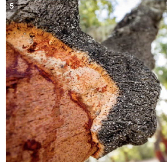
4. 포르투갈의 문화 유산인 코르크 숲.