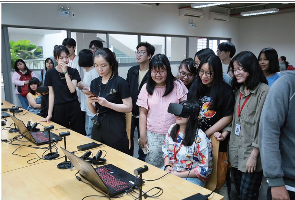
반랑대학교 그래픽 디자인 전공 학생들이 VR 장치로 가상현실 기술을 체험하고 있다.