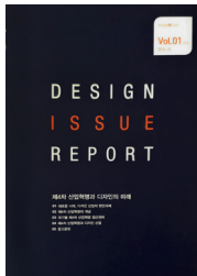
디자인 이슈리포트 1 표지