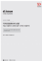
디자인 이슈리포트 vol.43 표지