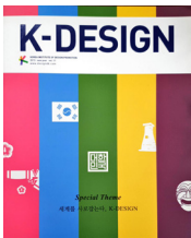
K-DESIGN 11 표지