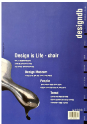
designdb vol.175 표지