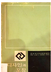
디자인과 포장1호 표지