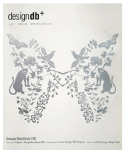
designdb+ vol.1 표지