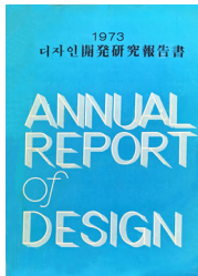
디자인개발연구보고서 1973 표지